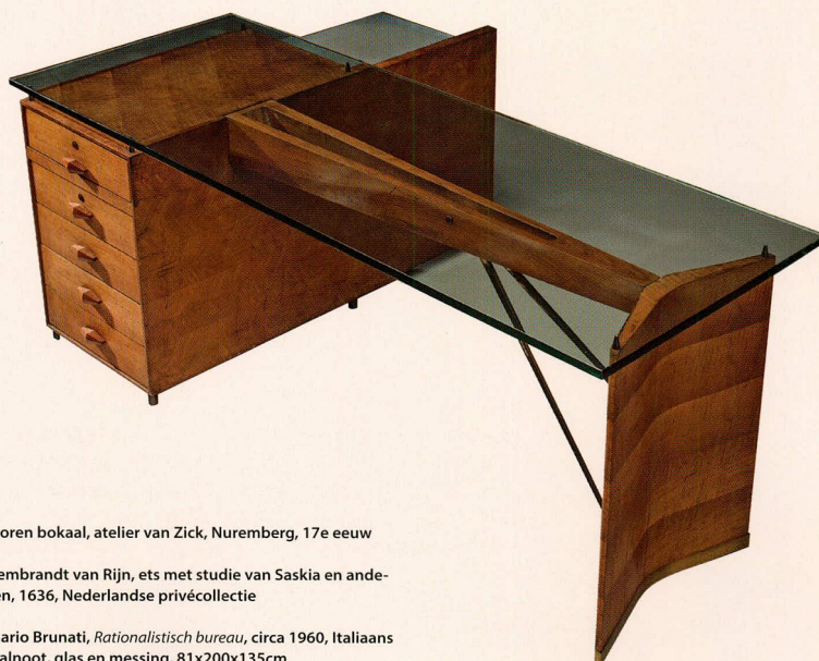
Ivoren bokaal, atelier van Zick, Nuremberg, 17e eeuw

Morentz (Waalwijk) is specialist in 20e-eeuwse designmeubelen en biedt op BRAFA een houten bureau met glazen blad van rond 1960 aan van de ontwerper Mario Brunati. Dat deze Italiaan ook architect is, is goed te zien aan het ontwerp en de afwerking van dit modern vormgegeven bureau. Het meubel is aan alle kanten voorzien van een geometrisch zigzagatroom en daardoor vrijstaand in de ruimte te gebruiken. De messing handgrepen complementeren het geheel.