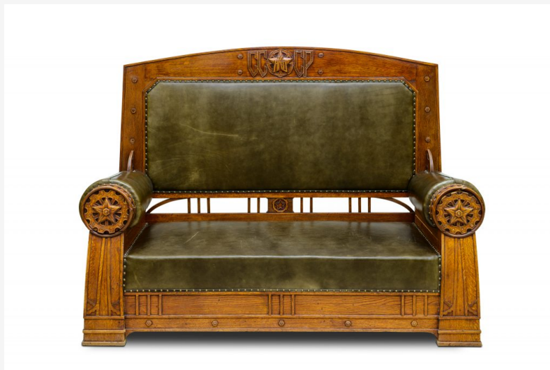
Canapé, Union Soviétique, 1938, conçu pour le Commissariat populaire de la Défense, bureau commémoratif « Voroshilov Corner ». Heritage Gallery