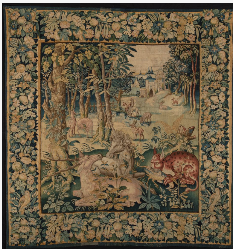
Tapissérie à la licorne, Sud des Pays-Bas, milieu du XVIe siècle, De Wit tapestries. Bien entendu, les galeries présentes à la Brafa proposent toute la richesse de l'art belge. Et c'est