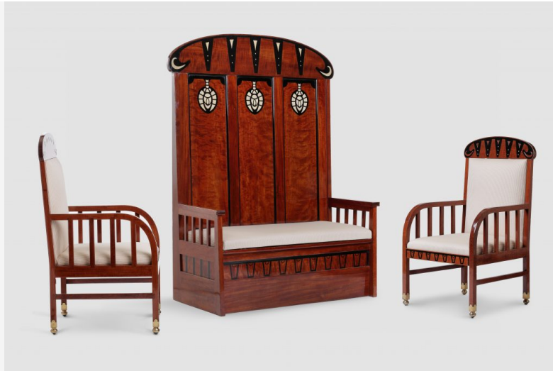
Mobilier Arts and Craft, Pays-Bas, avant 1902, bois de camphrier, ébène, ivoire, Galerie Francis Janssens van der Maelen