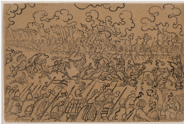
James Ensor (1860-1949), La Bataille des éperons d'or, 1888, crayon noir sur papier, Samuel Vanhoegaerden Gallery

Le visiteur ne sait plus où donner de la tête et veut tout acheter. Il aurait tort de se priver car une des caractéristiques de la Brafa c'est de proposer un large éventail de prix allant de 1 000 euros à plusieurs millions pour les objets-phares du salon. Sachant qu'en plus, la négociation est possible, faites-vous plaisir et n'hésitez pas à craquer. Et comme nombre des 70 000 visiteurs, vous deviendrez vite « accro » à la Brafa au point d'attendre chaque année avec impatience et