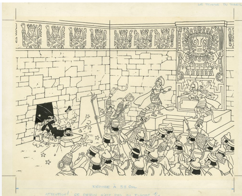
Hergé (1907-1983), Le Temple du soleil, 1970, encre sur papier, Huberty & Breynne Gallery