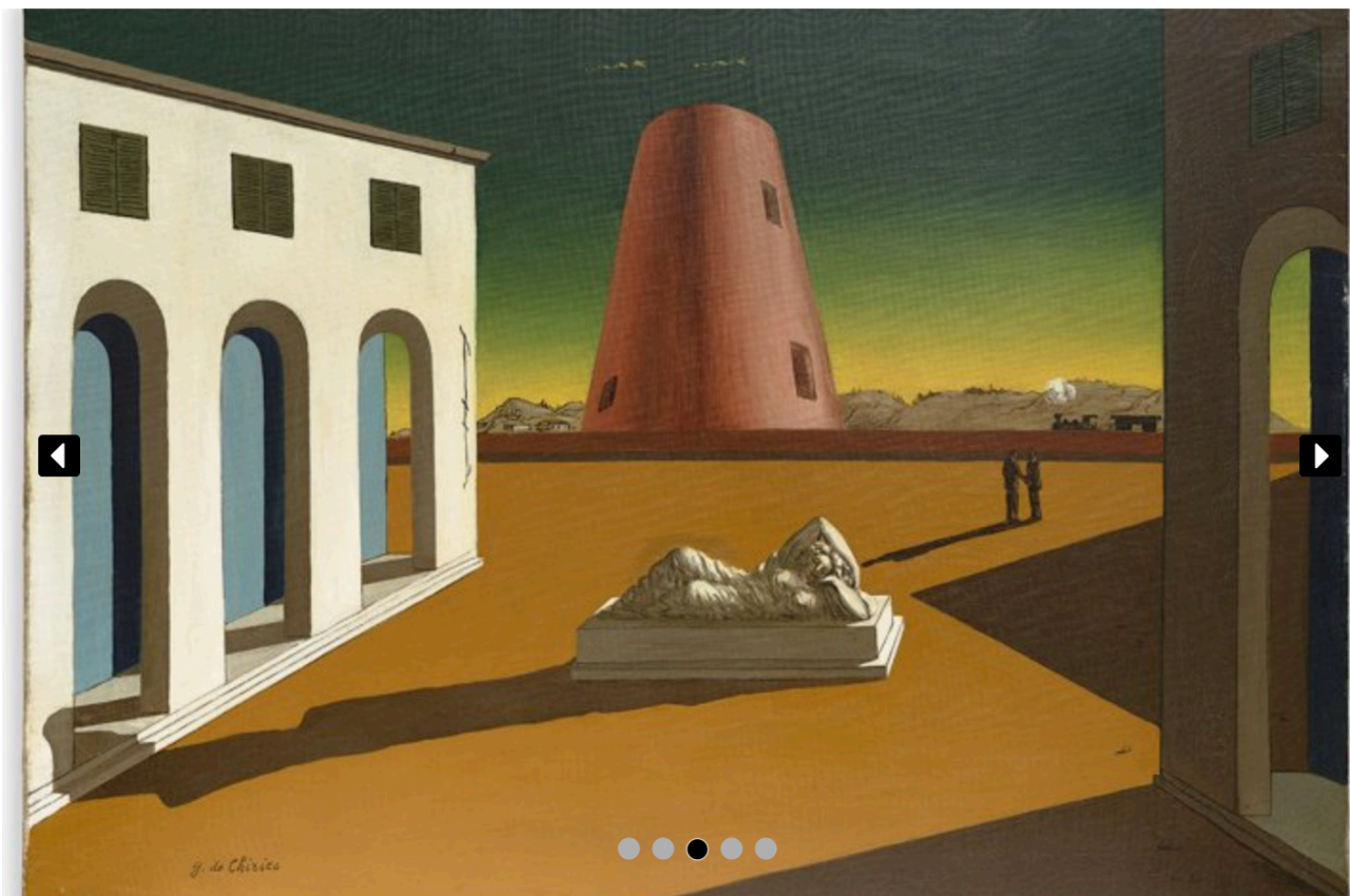
Die Galerie Repetto aus Lugano zeigt Giorgio de Chiricos «Piazza d'Italia con Arianna».