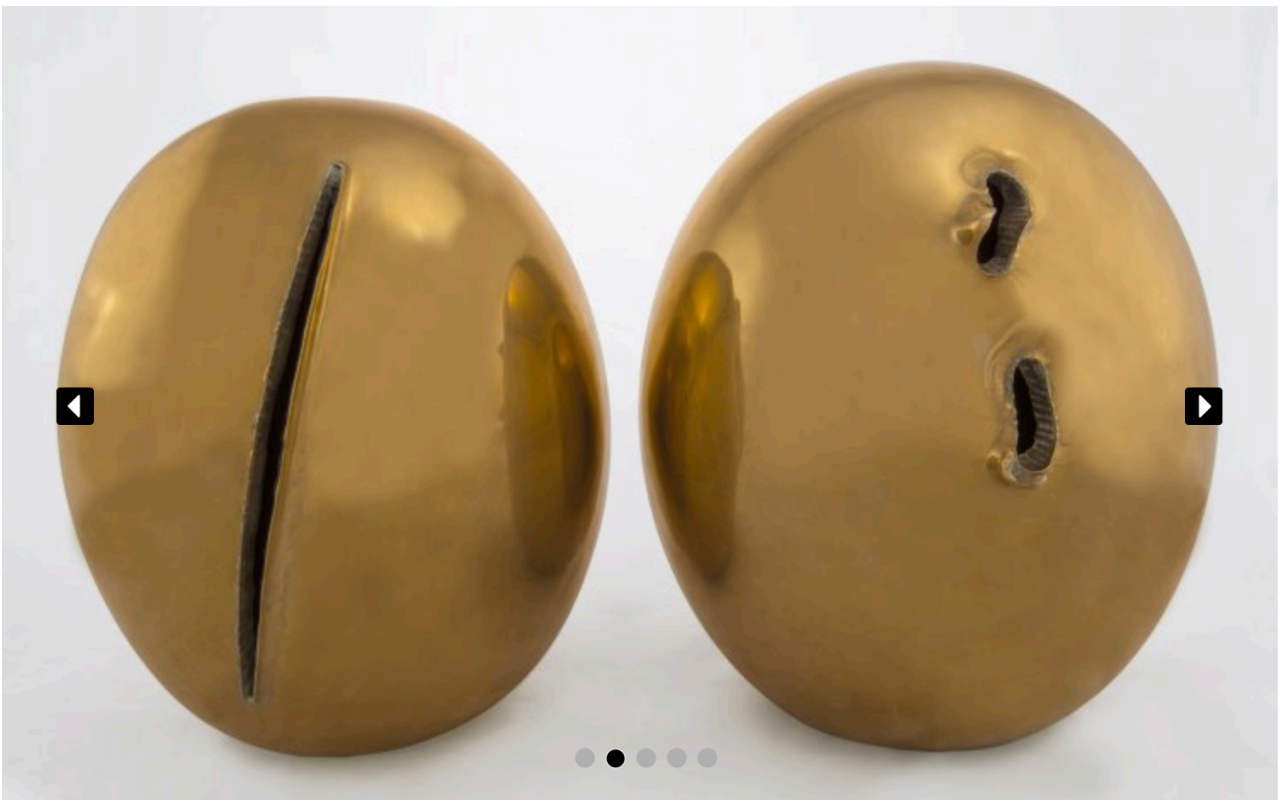
«Concetto Spaziale Natura» (1967) von Lucio Fontana ist ein zweiteiliges Kunstwerk aus poliertem Messing.