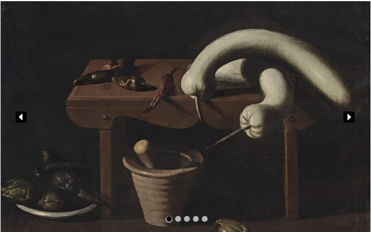
Ein Stilleben von Francisco de Zurbarán von 1600.

Dies belegen auch die 18 neuen Aussteller: So zeigt etwa die Nicolás Cortés Gallery europäische Gemälde und Skulpturen aus dem 15. bis Anfang 20. Jahrhunderts, darunter Werke von Goya, Ribera und Murillo. Bronzeobjekte, Skulpturen, Möbel, Gemälde und Art-Déco-Objekte aus dem 17. bis 19. Jahrhundert findet man derweil bei Ralph Gierhards Antiques / Fine Art.