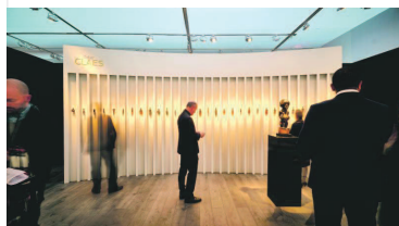
Didier Claes. DR

A son origine, en 1956, la Brafa était la réunion pionnière de marchands belges. Au fil du temps, elle s'est muée en une foire de dimension internationale, une mutation accélérée ces douze dernières années depuis son déménagement du vénérable Palais des Beaux-Arts, de la capitale belge, vers les vastes entrepôts industriels du site de Tour & Taxis, un ancien et vaste site bruxellois restauré avec beaucoup de goût. En 2020, la Brafa va accueillir 50 marchands nationaux et 83 d'origines étrangères. Parmi ces derniers, la