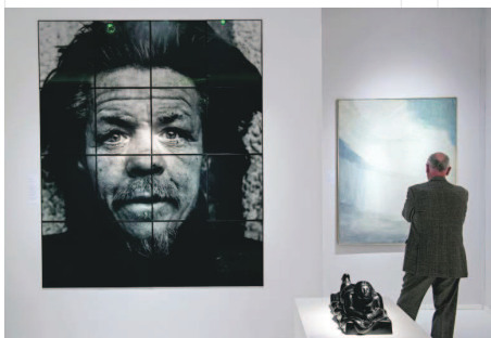
La 65e édition accueille 133 galeries et marchands d'art de renom.