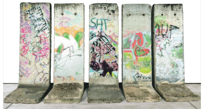
Cinq pans du Mur seront exposés lors de la Brafa 2020. RAF MICHELIS

PhK - Une vente caritative de cinq segments du Mur de Berlin sera organisée lors de la 65e édition de la Brafa, du 26 janvier au 2 février 2020. Ces pans seront exposés et vendus au profit (intégral) de cinq associations et musée actifs dans les domaines de la recherche contre le cancer, de l'intégration des personnes handicapées et de la préservation du patrimoine artistique. Ils ont été spécialement acquis en 2018, en anticipation du 30e anniversaire de la chute du Mur célébré le 9 novembre dernier. D'une hauteur de 3,8 mètres et d'une largeur de 1,2 mètre pour un poids de 3,6 tonnes chacun, ils sont porteurs de graffitis sur les deux faces, ajoutés par des graffeurs anonymes à différentes époques. Ils seront exposés dans le hall.